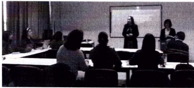
Doctorado en Ciencias para el Aprendizaje