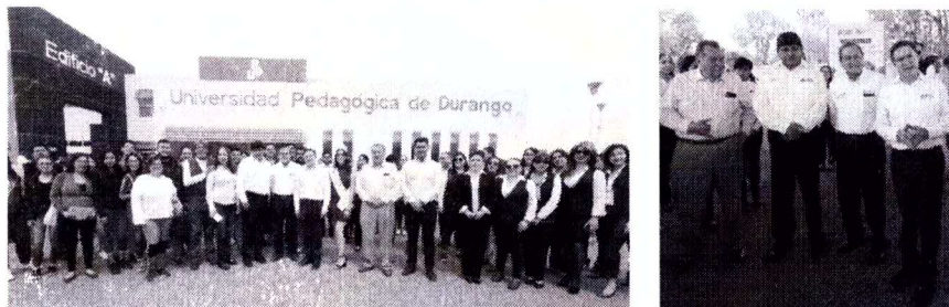
Visita del C. Gobernador Constitucional del Estado a la UPD