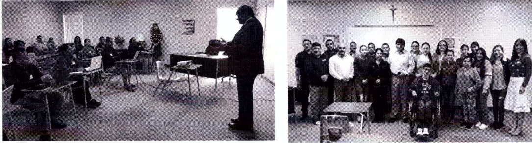
LCE en Houston, TX.