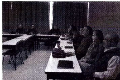
Cursos de certificación a docentes