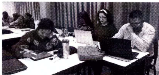
Seminario “la investigación como responsabilidad social”