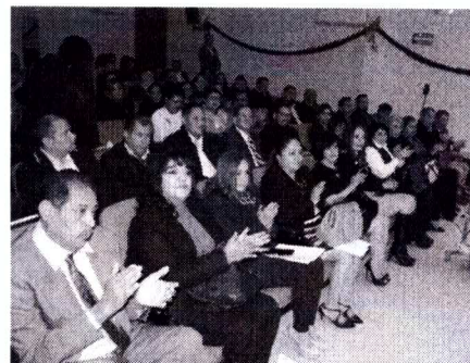
Procesos de formación y actualización con las Instituciones Formadoras de Docentes del Estado