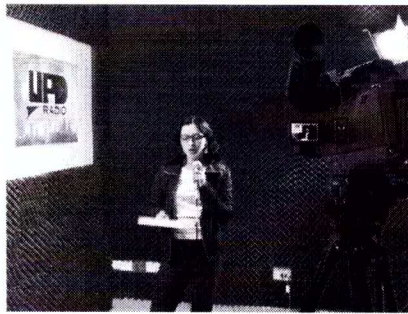
Casting "Identidad Poder Joven"