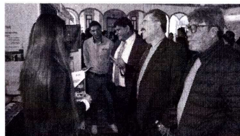
Expo Decídete 2019