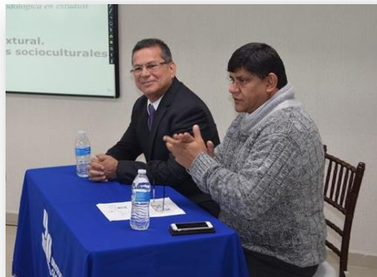
3er. Congreso Interinstitucional: “Formación de Investigadores en el Posgrado”