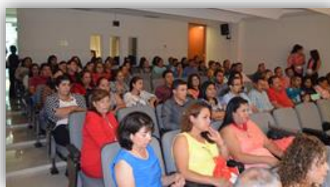
Presentación del libro “Los Actores Educativos. Una Visión Psicopedagógica”