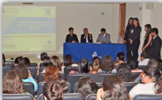
Presentación de los “Modelos Educativos para Jóvenes y Adultos”