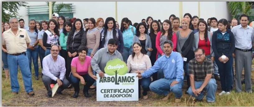
Incorporación de UPD al programa “Arbolamos Durango”