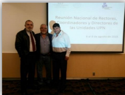
Reunión Nacional UPN