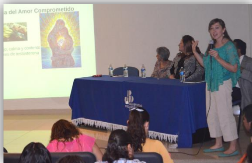
Panel “Sexualidad Integral”