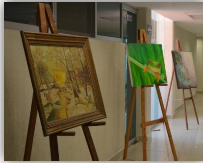
Festival cultural "Día de la Madre Tierra 2015"