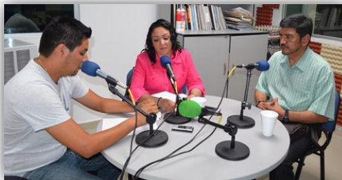
Visita de personal de la Universidad Autónoma del Estado de México