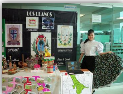
Muestra cultural “Historia Regional y Formación Docente”