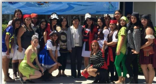
Festival del día del niño organizado para la casa hogar "San Agustín"