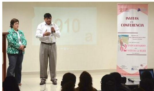
Conferencia conmemorativa del 62 aniversario del voto de la mujer mexicana