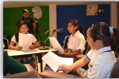
Emisiones de radio "Los Insectos" y "Derechos o Chuecos"