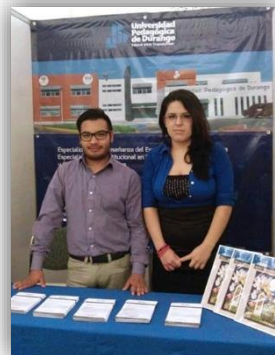
2° Encuentro de Jóvenes Investigadores