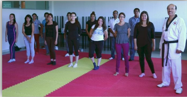
Equipo de Tae Kwon Do