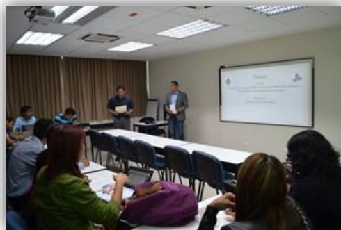
Primer foro de presentación de avances de investigación