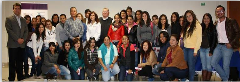
Conferencia “Derechos Políticos y Electorales de la Mujer”