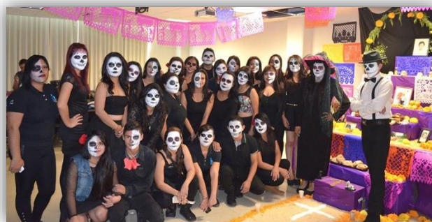
Exposición de altar de muertos