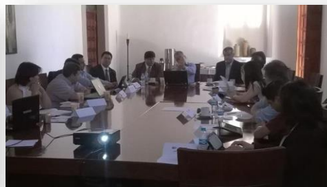
Equipo interdisciplinario UPD – SFA – UJED – ITD – BM, de la Especialidad en EGpR