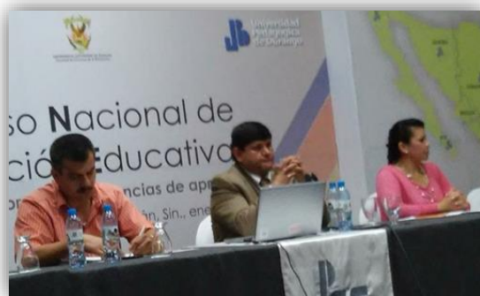
Presentación en el 2º Congreso Nacional De Innovación Educativa