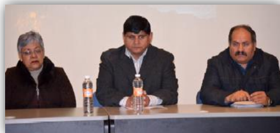
Actividades del “Foro institucional de presentación de proyectos de innovación de la práctica docente 2015”