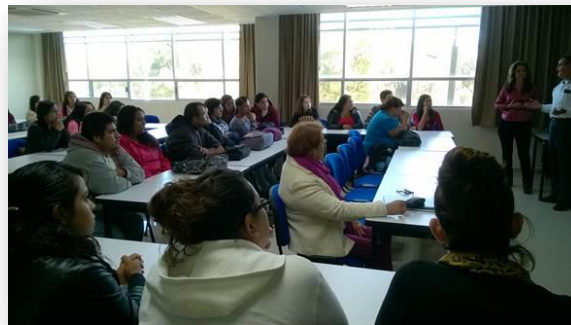
Taller “Creación de una ONG y elaboración de proyectos financiados”