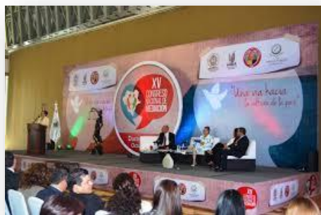
XV Congreso Nacional de Mediación