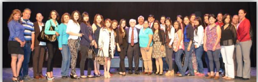
Conferencia “Presente y Futuro de la Psicología Cognitiva”