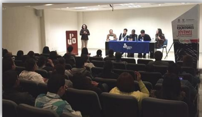
Panel de escritores y círculo de lectura