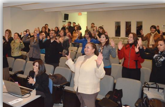
Actividades del “XV foro la enseñanza situada en el ámbito de las teorías del aprendizaje”