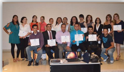
Presentación de proyectos “Estrategias y Medios para la Enseñanza”