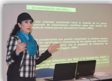
Actividades del “3er. Foro de avances de investigación del Doctorado en Ciencias para el Aprendizaje”