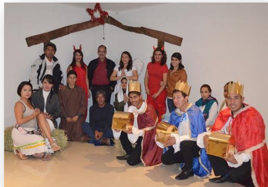
Presentación de pastorela