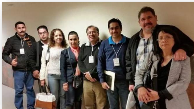
Asistentes al XIII Congreso Nacional de Investigación Educativa COMIE