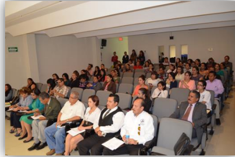
Concurso de oratoria "El Maestro, la Historia y la Patria"