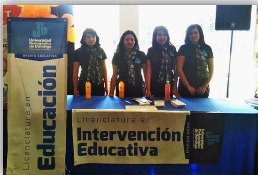
Presencia de la UPD en la feria vocacional de la DGETI