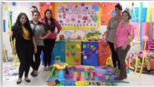
Exposición “Juegos y Juguetes para Niños de 1 a 6 años”