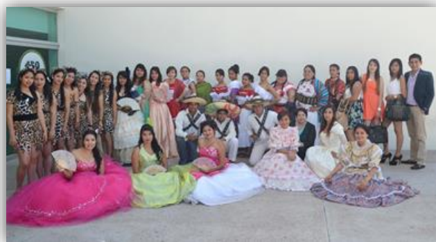
Exposición “La Trascendencia de la Mujer Mexicana, desde la Prehistoria hasta la Época Actual”