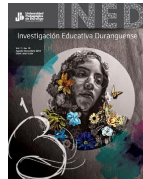
Revista Investigación Educativa Duranguense

En cuanto a las publicaciones, se tiene el volumen 11, número 19 de la revista Investigación Educativa Duranguense (ISSN 2007-039X), además de los libros electrónicos: "Autorregulación emocional y procesos de aprendizaje, un estudio de caso múltiple"; "el liderazgo directivo en el ámbito de la gestión escolar" e "Inteligencia emocional y resiliencia, un aporte al campo".