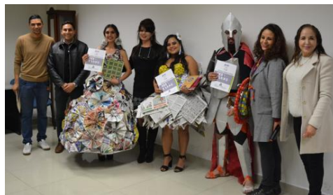
Concurso de trajes de material reciclado