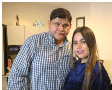
Encuentro de radio y televisión "Dilo fuerte"