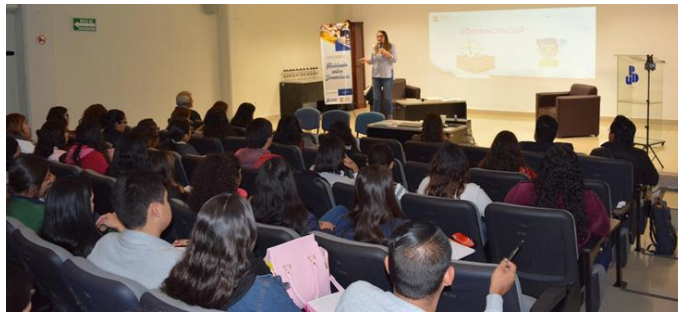
Coloquio "Hablando sobre democracia"