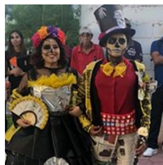
Celebración del Día de Muertos