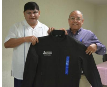
Entrega de uniformes al personal de apoyo