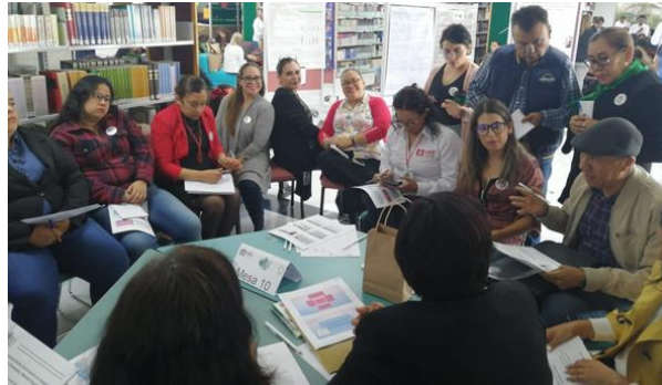
Cuarto Encuentro Regional de Tutoría