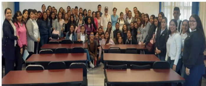
Feria regional del libro

En la UAEGP se participó en la Primera Feria Regional del Libro, convocada por la SEED en la Comarca Lagunera. En el marco de esta Feria, se dictó la conferencia magistral "La importancia de la lectura en los futuros docentes".