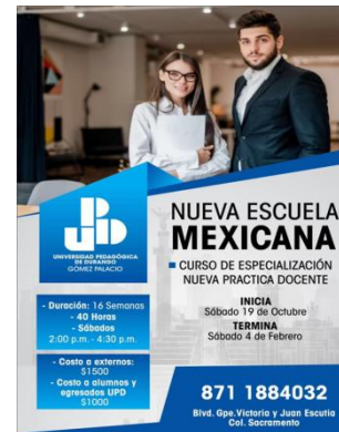
Oferta del curso "La nueva escuela mexicana"