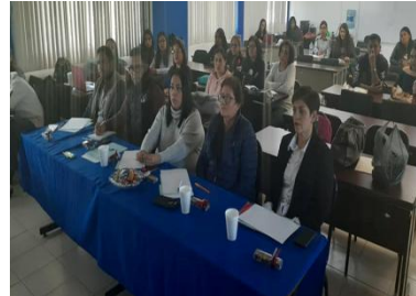
Curso "Primeros auxilios" y Foro de presentación de proyectos de titulación