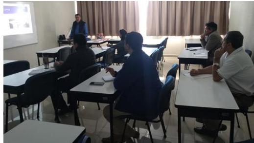
Curso de inducción a LEPEPMI