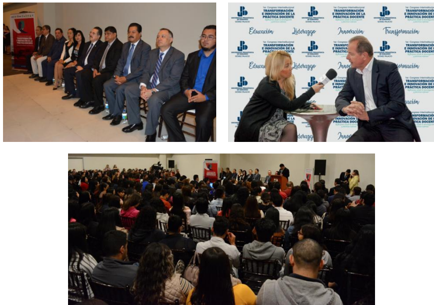
7mo. Congreso Interinstitucional

Se llevó a cabo del 7mo. Congreso Interinstitucional 2019 "Transformación e Innovación de la Práctica Docente", a través de 24 talleres, siete paneles de discusión, presentación de cuatro libros, dos magnas conferencias y 22 mesas de trabajo. La participación de la comunidad universitaria ascendió aproximadamente a 500 participantes.