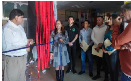
Coloquio "Hablando sobre democracia"