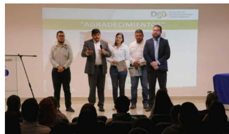
Programa de reforestación