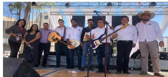
Presentación de grupos culturales en la ciudad de Gómez Palacio