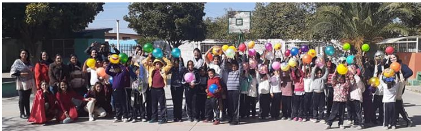
Gira de actividades culturales de los estudiantes de la UAEGP