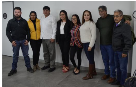
Concurso "Dell Policy Hack"