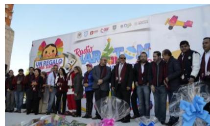
Feria Educativa y Radiomaratón 2019