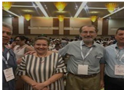
Académicos de la Universidad en el Congreso Nacional de Investigación Educativa