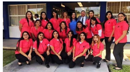
Entrega de uniformes deportivos