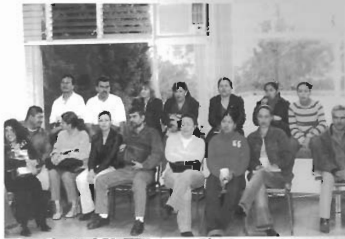
Aspectos generales del festival de bienvenida.