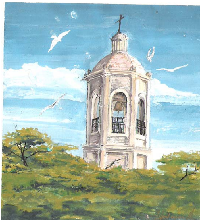
Ilustración 3 Iglesia en arboleda