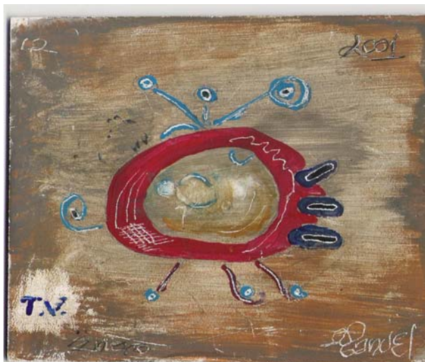
Ilustración 2 La televisión