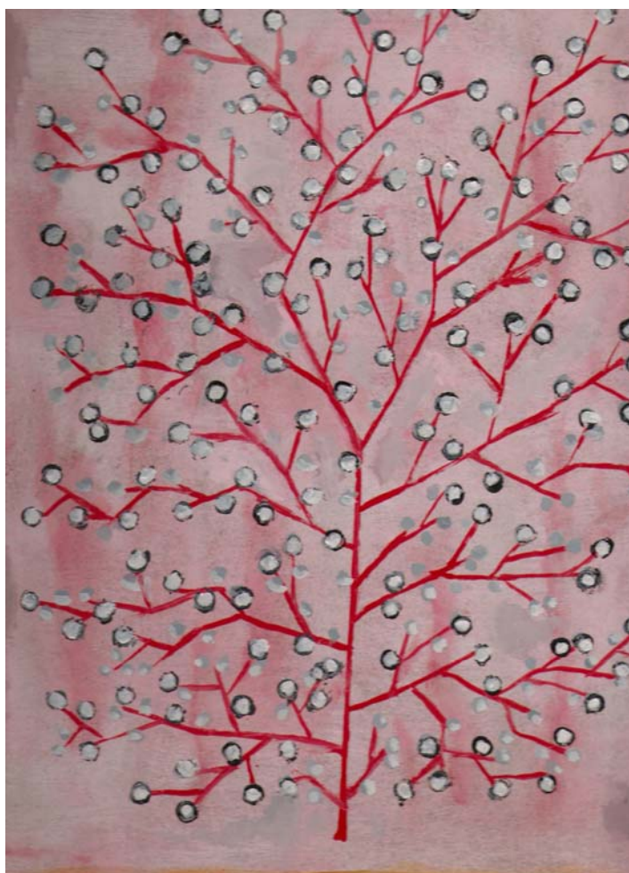
Ilustración 4 Árbol en otoño